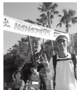
2013年12月那覇マラソン

一番の気分転換は運動です。特にランニングはシューズとウェアがあればできるので、会社帰りに社内・社外の仲間と皇居近くのランニングステーションに集まって走り回っています。